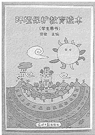
1等賞を受賞した副読本